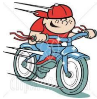
7.- ride a bike