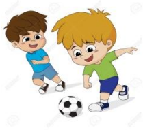
6.- play soccer